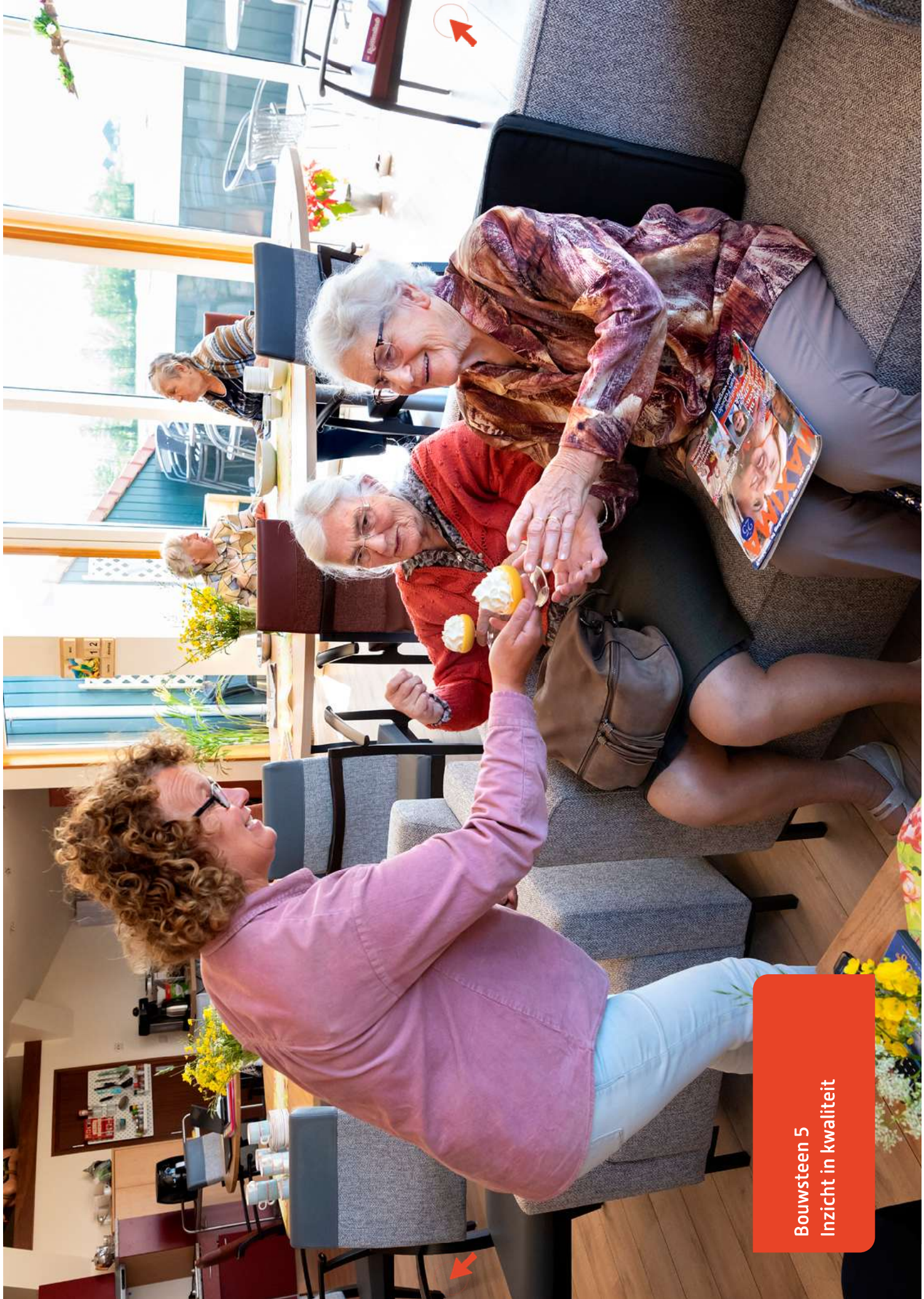
Bouwsteen 5 Inzicht in kwaliteit