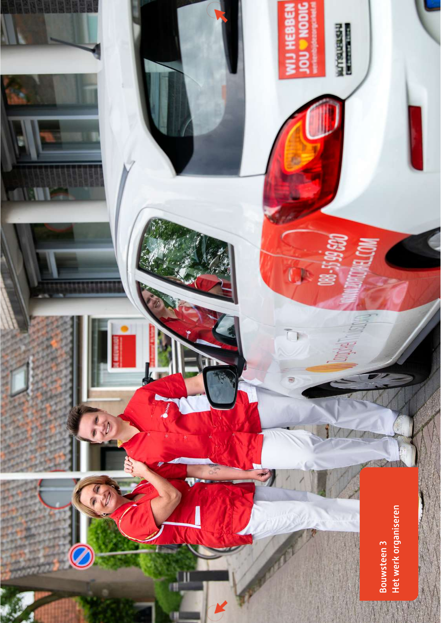
Bouwsteen 3 Het werk organiseren